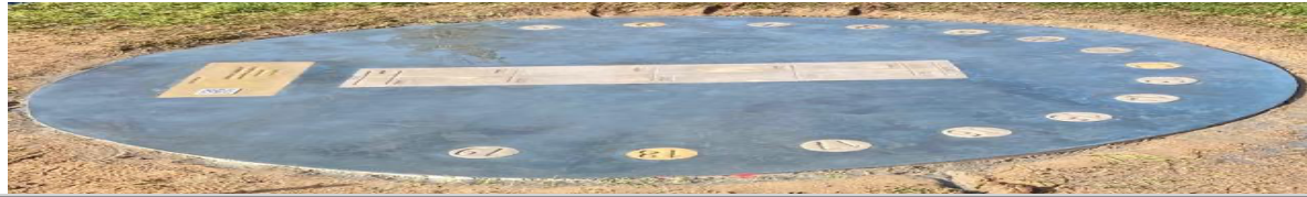
GRAPHE DE L'ÉQUATION DU TEMPS ( 2022 ) Temps en minutes à ajouter au Temps Solaire pour obtenir le Temps Moyen